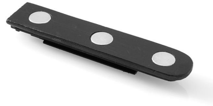
Art. GLZM 45/3-074 Plastica robusta nera magnetica