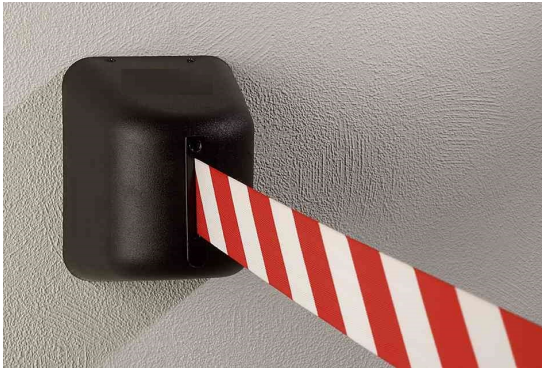
Art. GLW 480-J/13-8.0mt