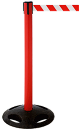
Art. GLA 25-D/13-4,0mt