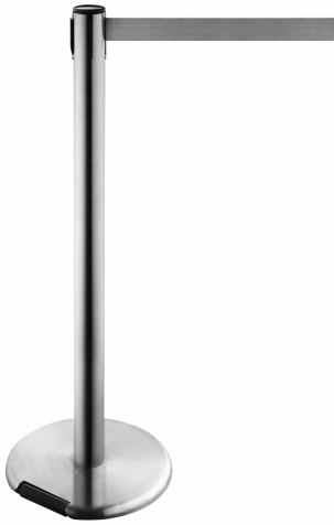
Art. 1: GLAR 45-S