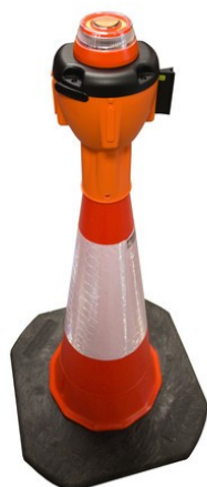
Fig. 1: Luce lampeggiante ALCT-FL sull'attacco del cono stradale ALCT-O (l'attacco del cono stradale e il cono stradale non sono inclusi nella fornitura)