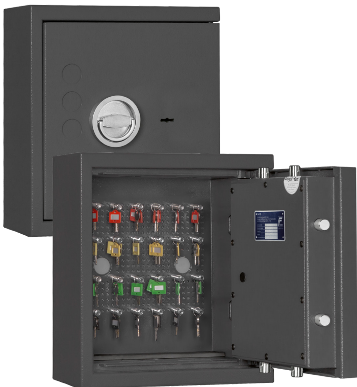
STL 24 Grigio chiaro • graphite grey Accessori non incluso nel prezzo • decoration not included in the delivery

Armadio portachiavi/di sicurezza, grado 0 (EN 1143-1) Key-/safe, Grade 0 (EN 1143-1)