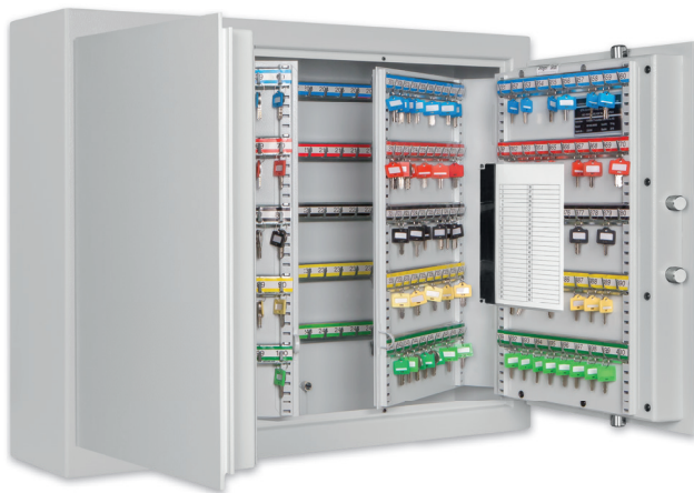
ST 400 Z Grigio Chiaro •light grey Accessori non incluso nel prezzo •decoration not included in the delivery